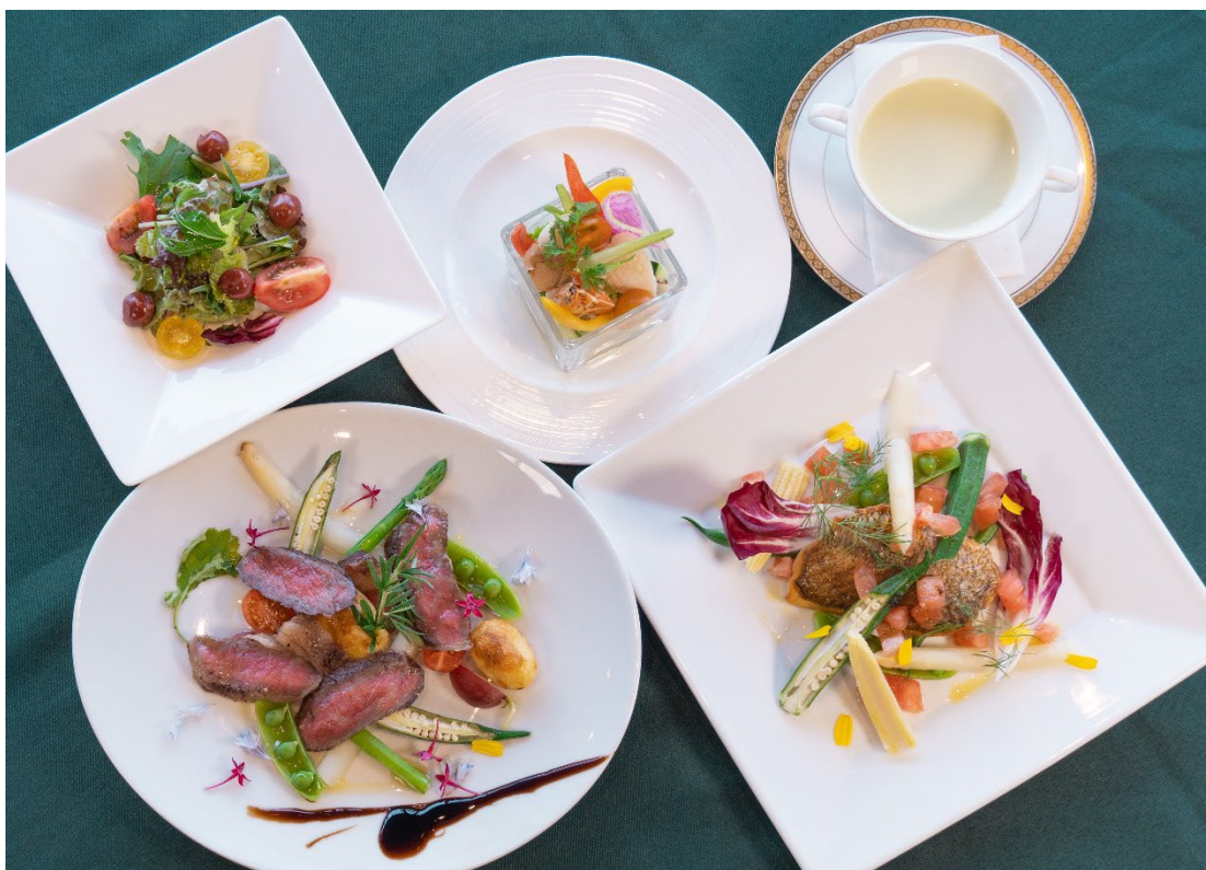
但馬牛ロースとコンビネーションサラダ (左) /カンパチのソテー フレッシュトマトソース (右)