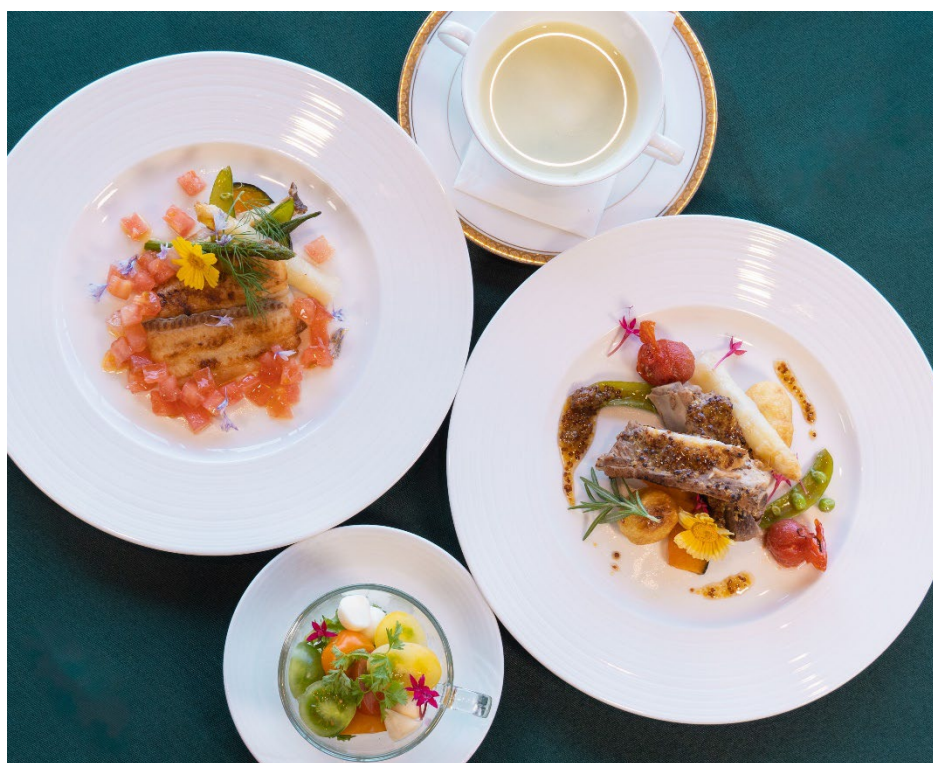
舌平目のソテー ケッカソース (左) / スペアリブのソテー 自家養蜂ハチミツと粒マスタード添え (右)